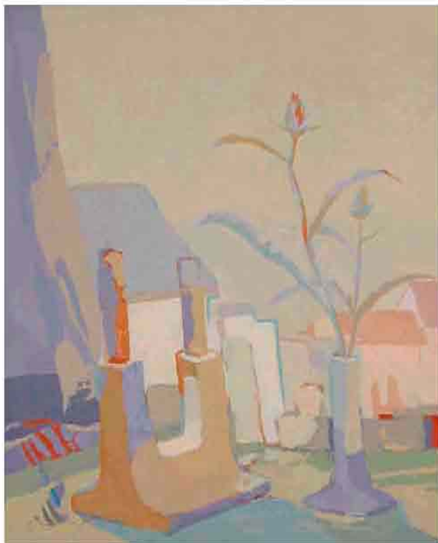
Parejas Óleo sobre tela 50x61 cm