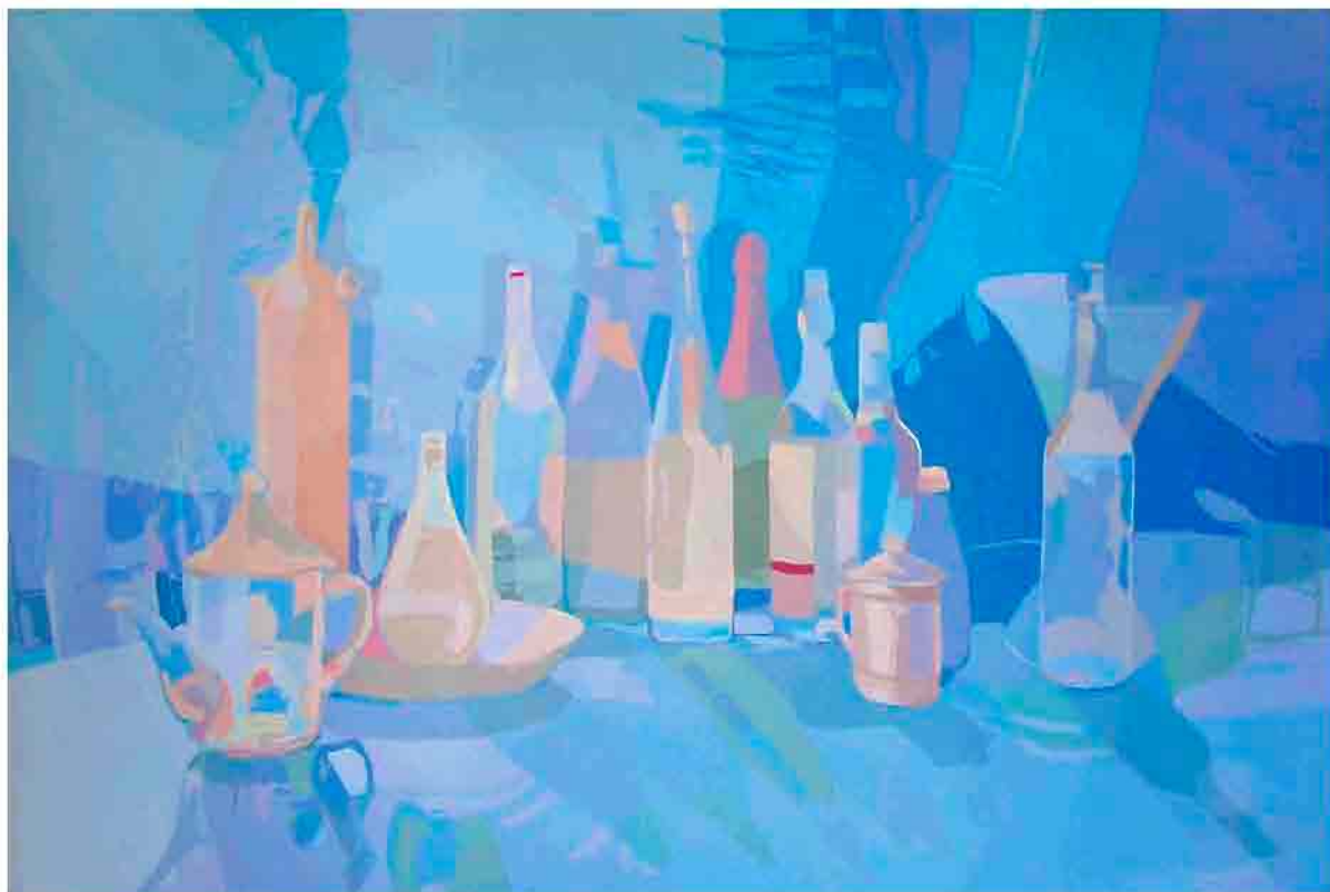
Barro y cristal Acrílico sobre tela 196x130 cm