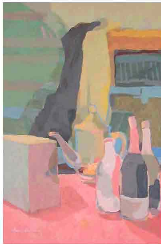
La tetera Óleo sobre tela 55x81 cm