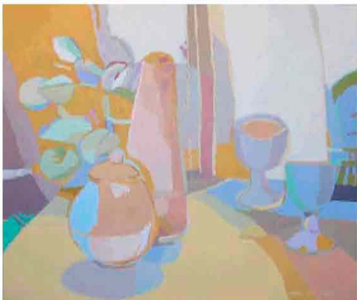
Bodegón con dos copas Acrílico sobre tela 55x46 cm