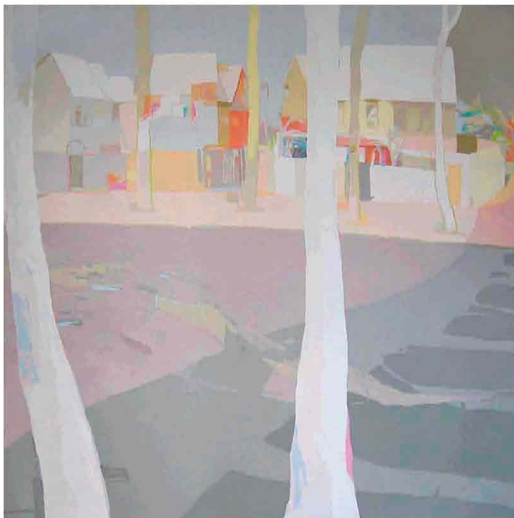
Árboles blancos Acrílico sobre tela 150x160 cm