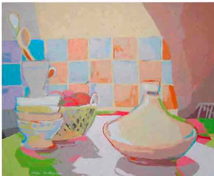
Alacena Acrílico sobre tela 61x50 cm