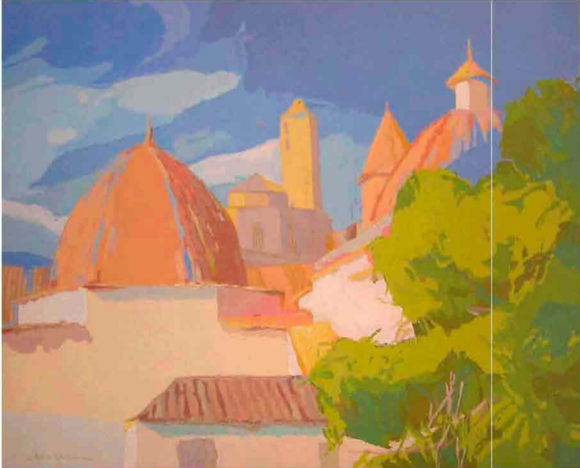
Tejados Acrílico sobre tela 100x81cm