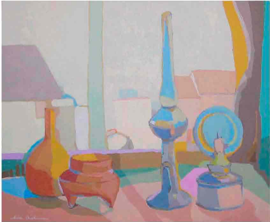
Bodegón con paisaje Acrílico sobre tela 55x46 cm