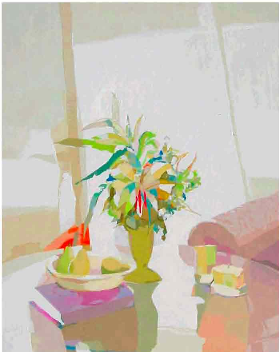
La mesa de cristal Acrílico sobre tela 130x162 cm