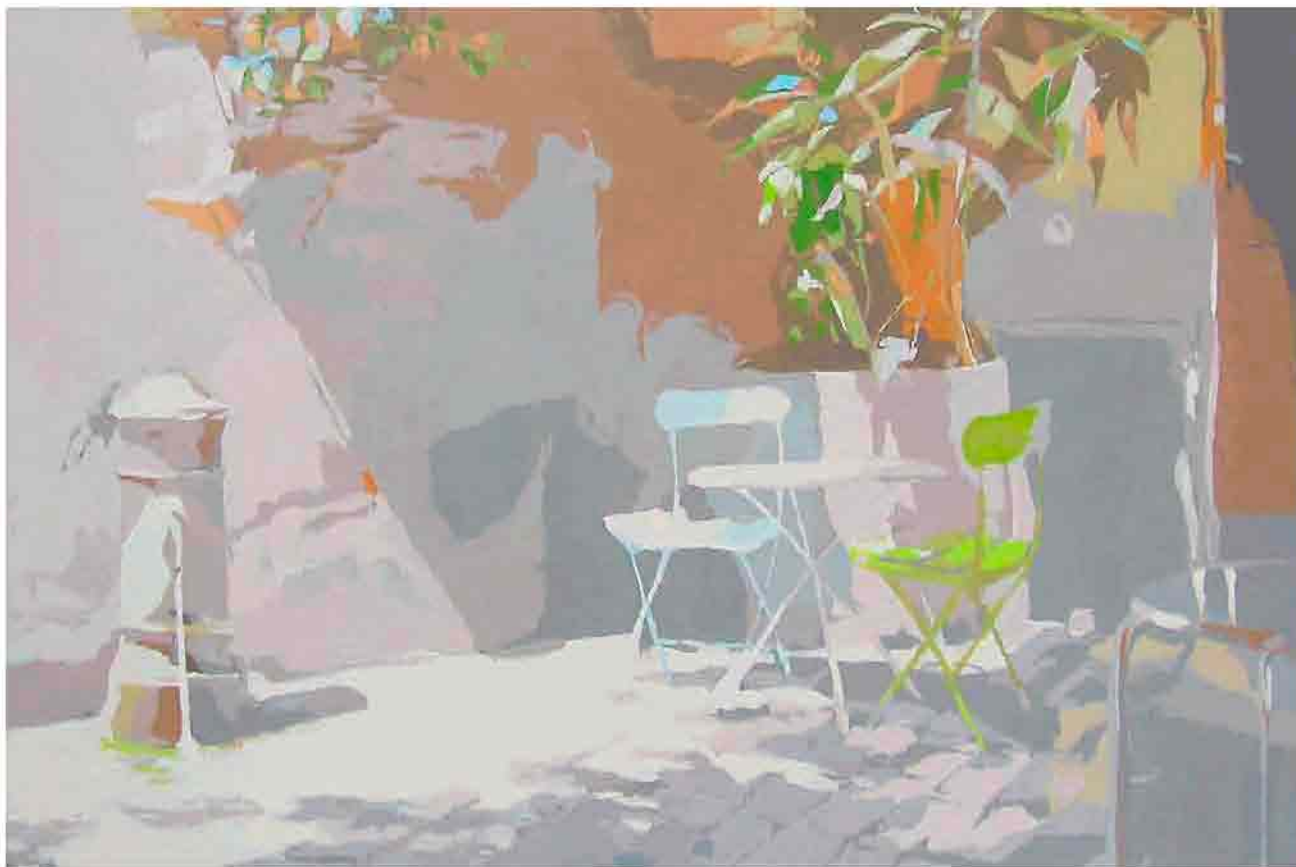
Sol y sombras Acrílico sobre tela 196x130 cm