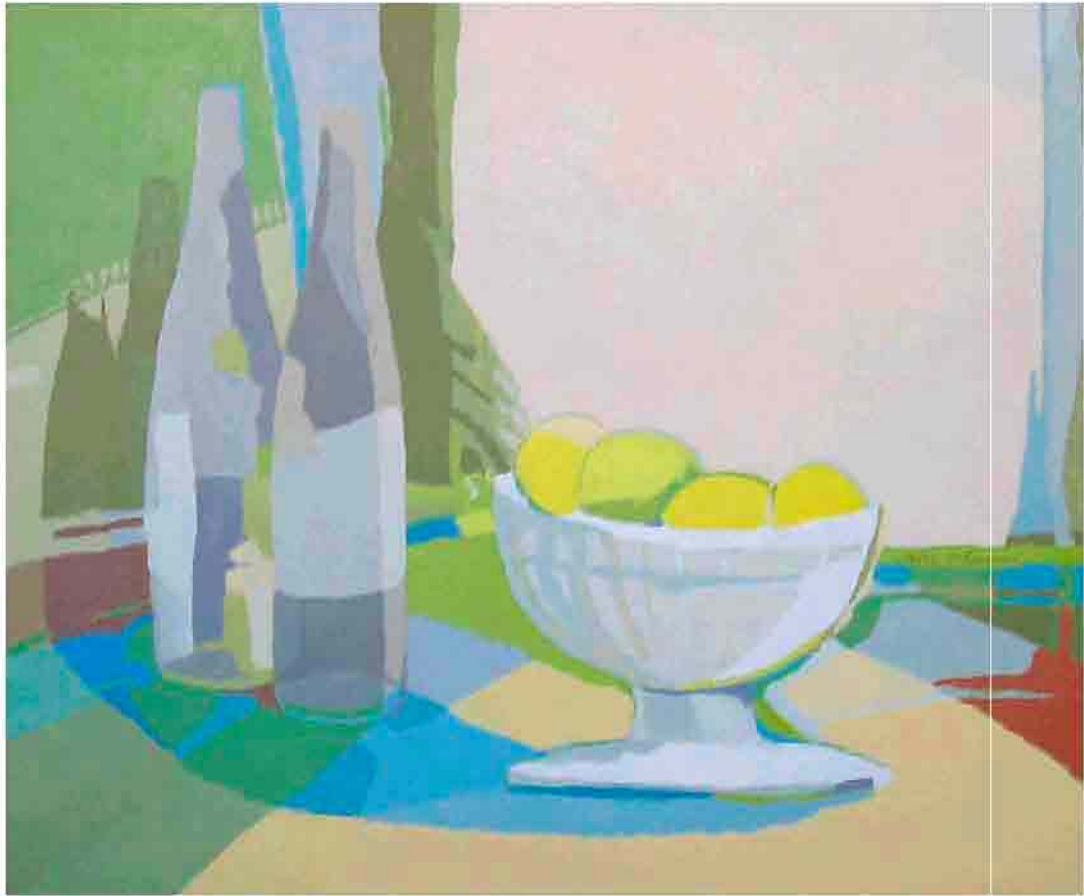
Bodegón con limones Acrílico sobre tela 55x46 cm