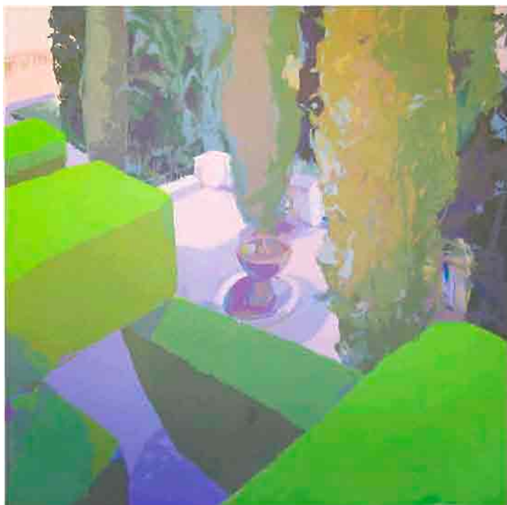
Cipreses Acrílico sobre tela 100x100 cm