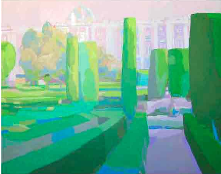
Setos de boj Acrílico sobre tela 91x73 cm