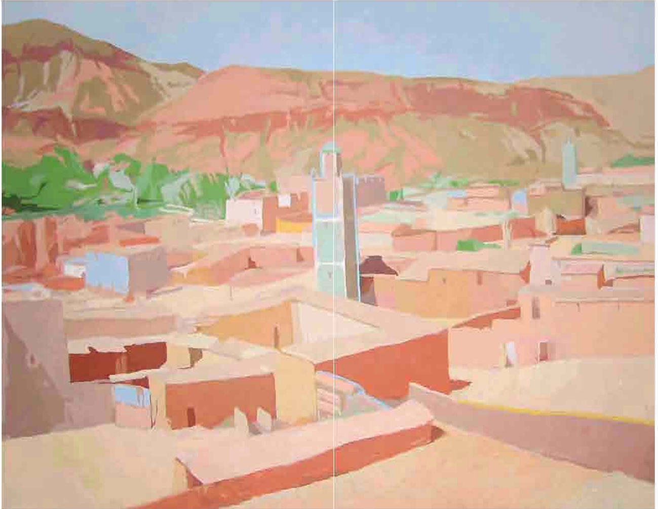
Minaretes Acrílico sobre tela 146x114 cm