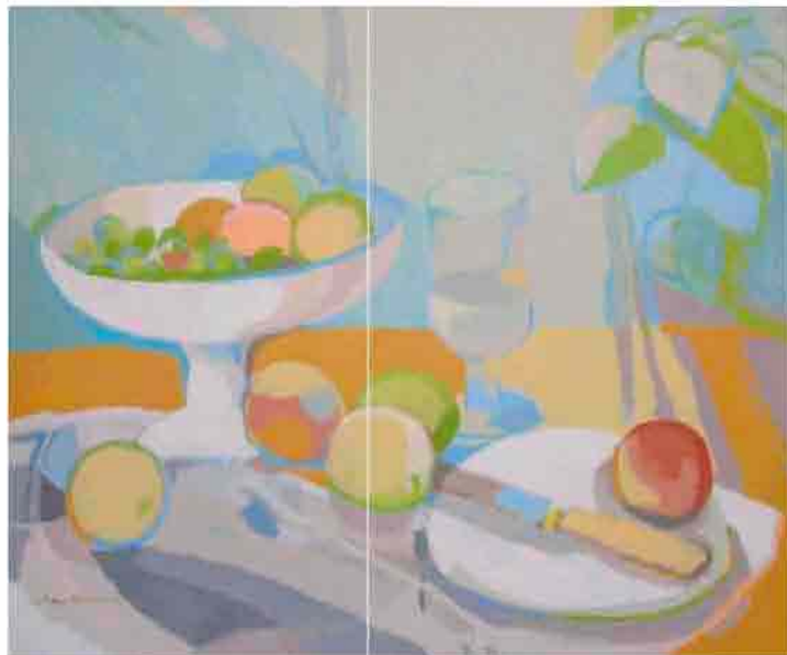
Frutero, copa y manzanas Acrílico sobre tela 55x46 cm