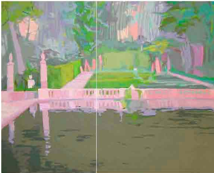
Estanque Acrílico sobre tela 100x81 cm