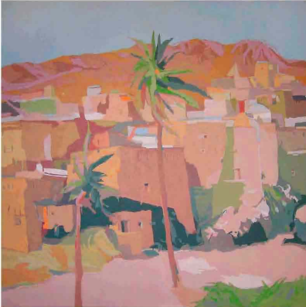
Kasbah violeta Acrílico sobre tela 100x100 cm