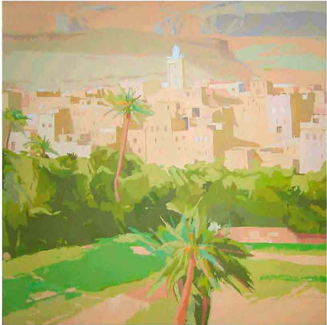
Kasbah dorada Acrílico sobre tela 100x100 cm