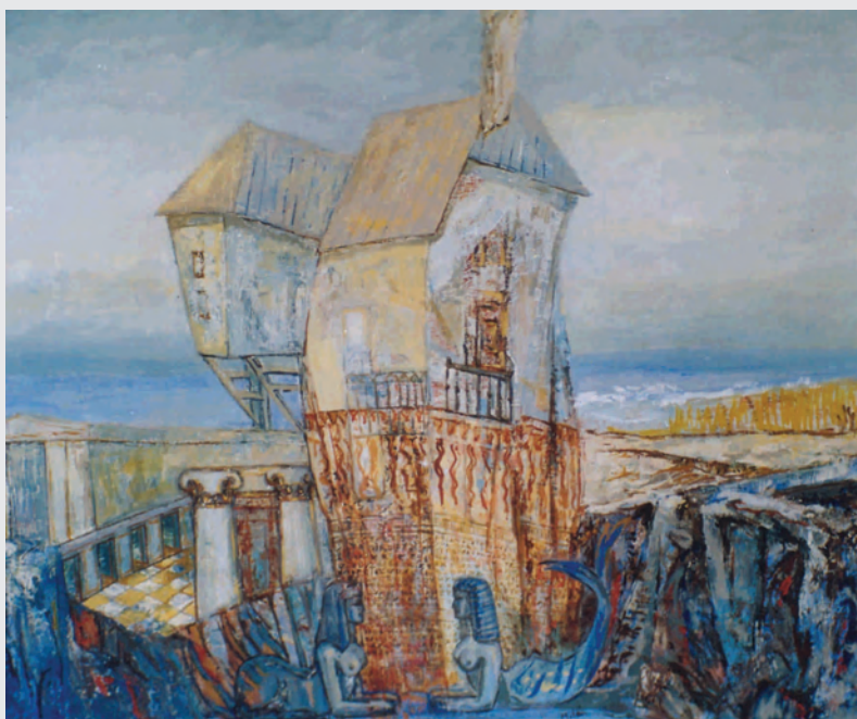
A nuestros pies Óleo sobre tela 100x81 cm