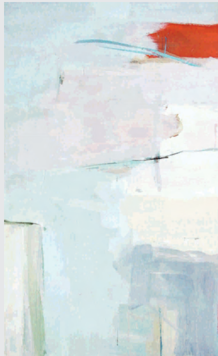
Otoño Acrílico sobre tela 84x117 cm