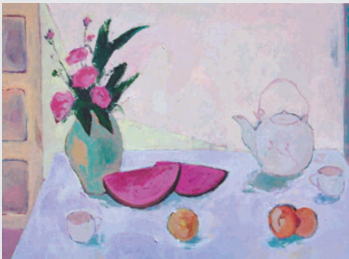
Té para dos Acrílico sobre tela 120x120 cm