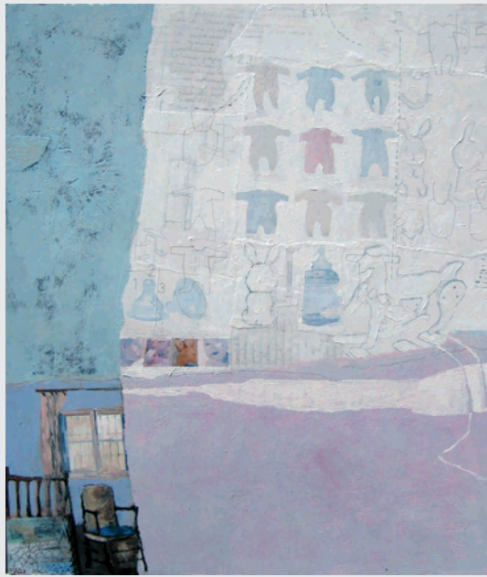
La habitación de la hija Mixta sobre tabla 60x70 cm

Javier Rubio Nombrot Pintor · Crítico de Arte El Punto de las Artes, nº 702.