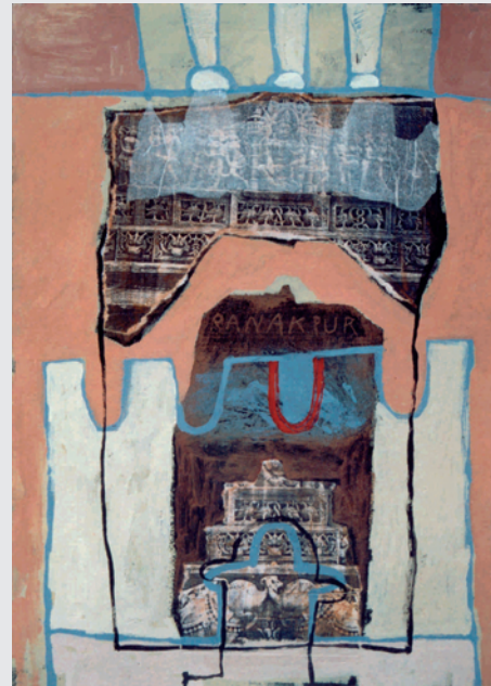
Templo de Ranakpur Mixta sobre tabla 35x50 cm