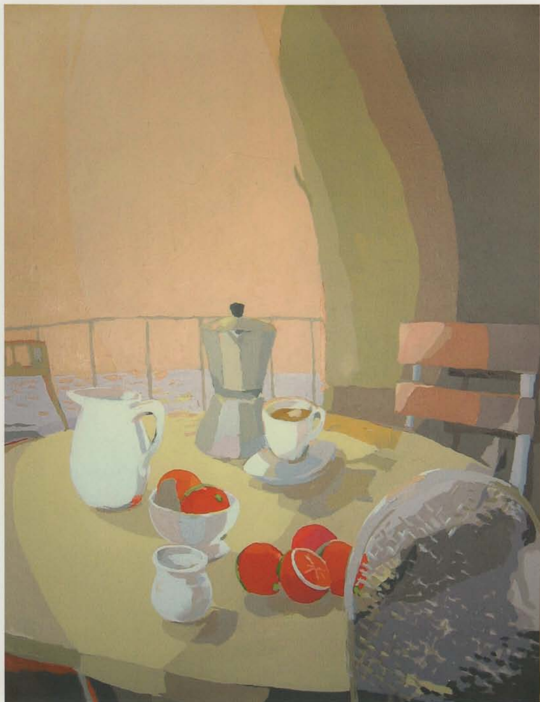
Un café Acrílico/tela, 116x89 cm