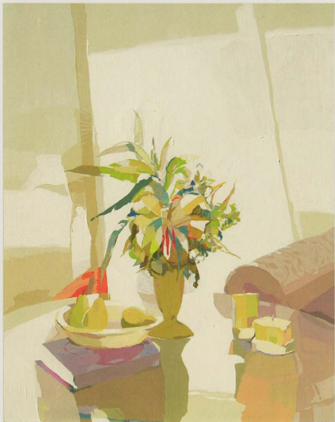
La mesa de cristal Acrílico/tela, 162x130 cm