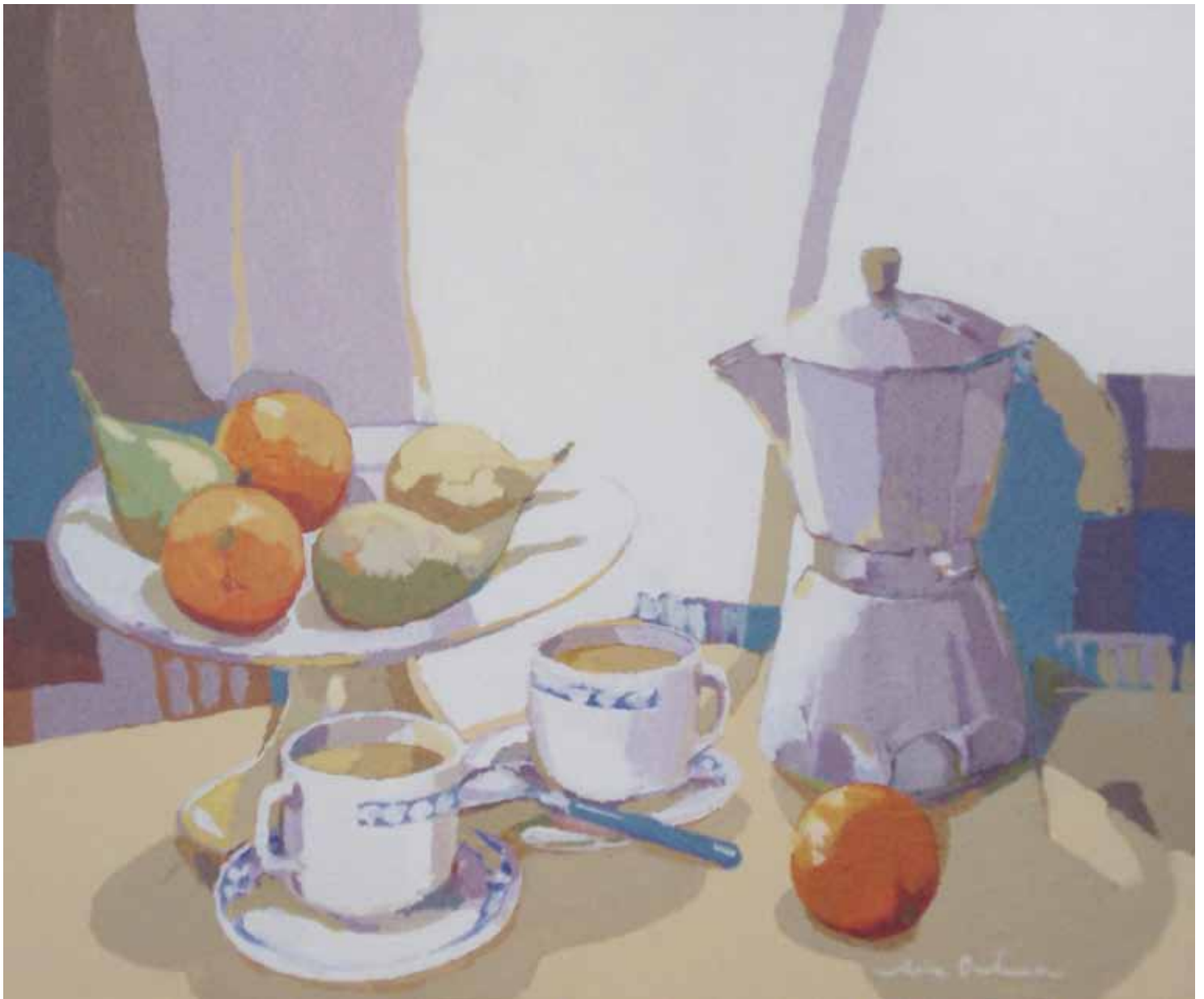
BODEGÓN DEL CAFÉ Acrílico sobre lienzo 46x55 cm