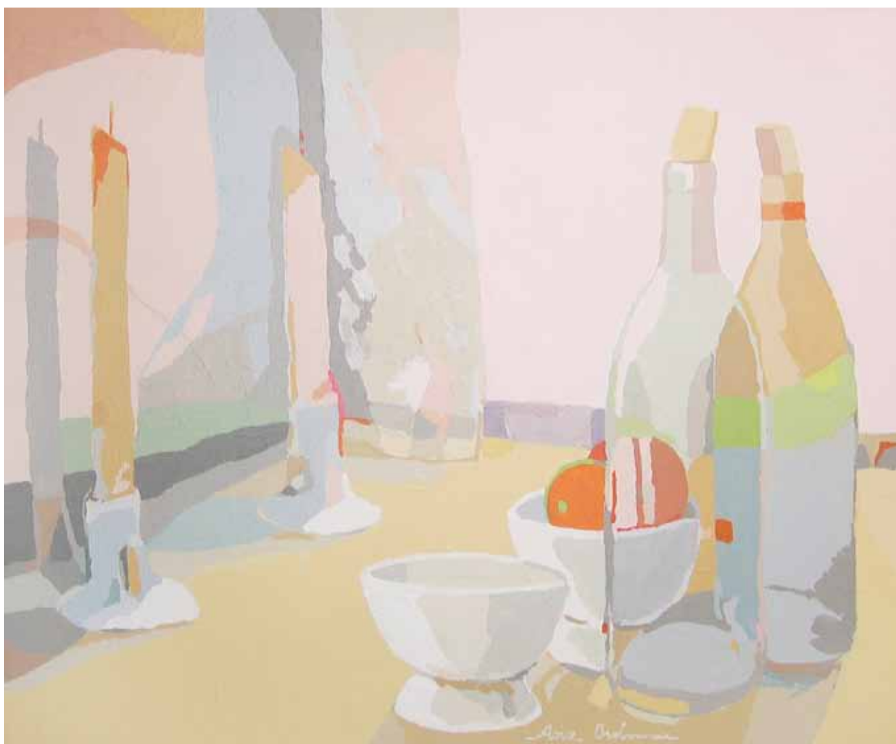
DE DOS EN DOS Acrílico sobre lienzo 38x46 cm