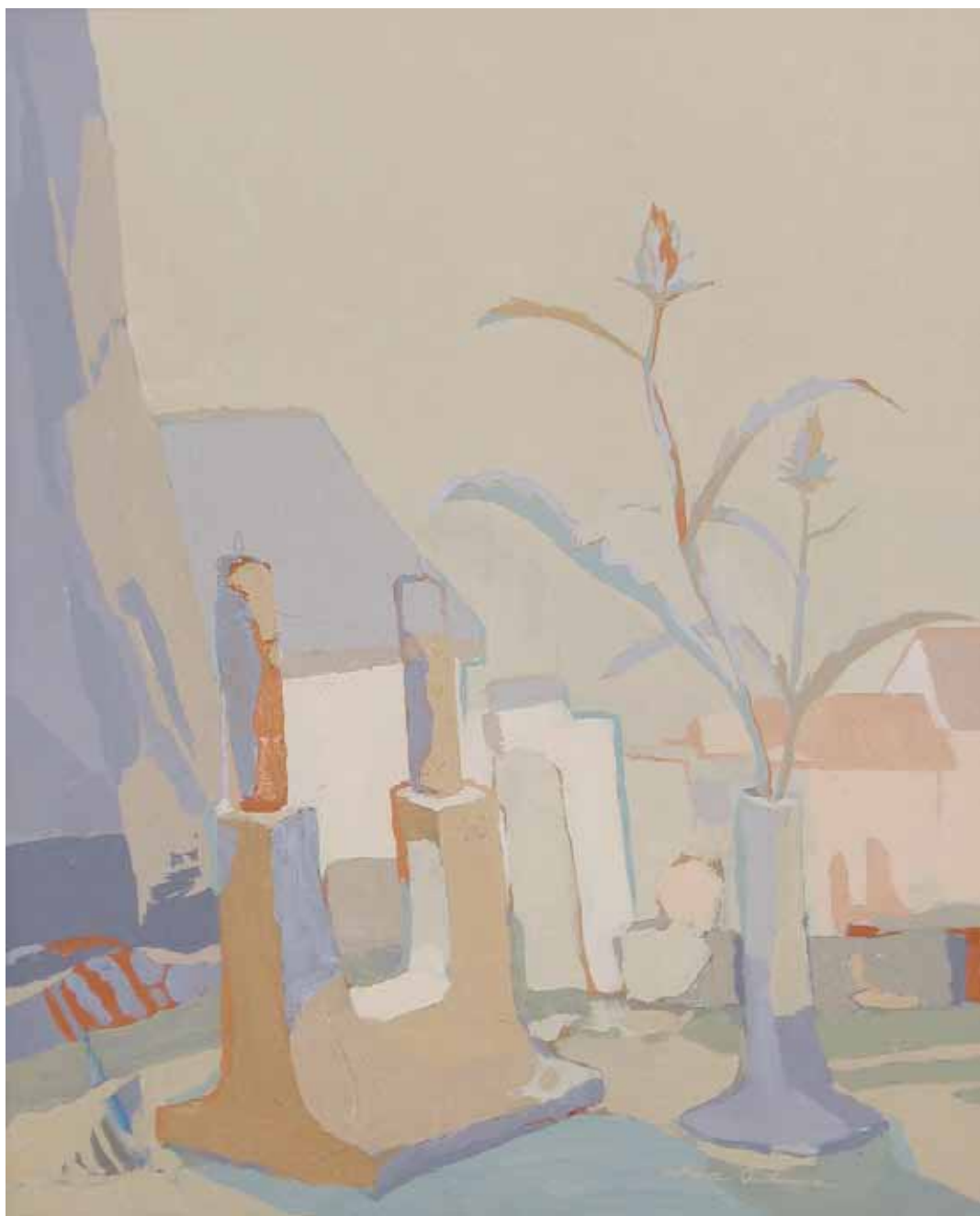
PAREJAS Óleo sobre lienzo 61x50 cm