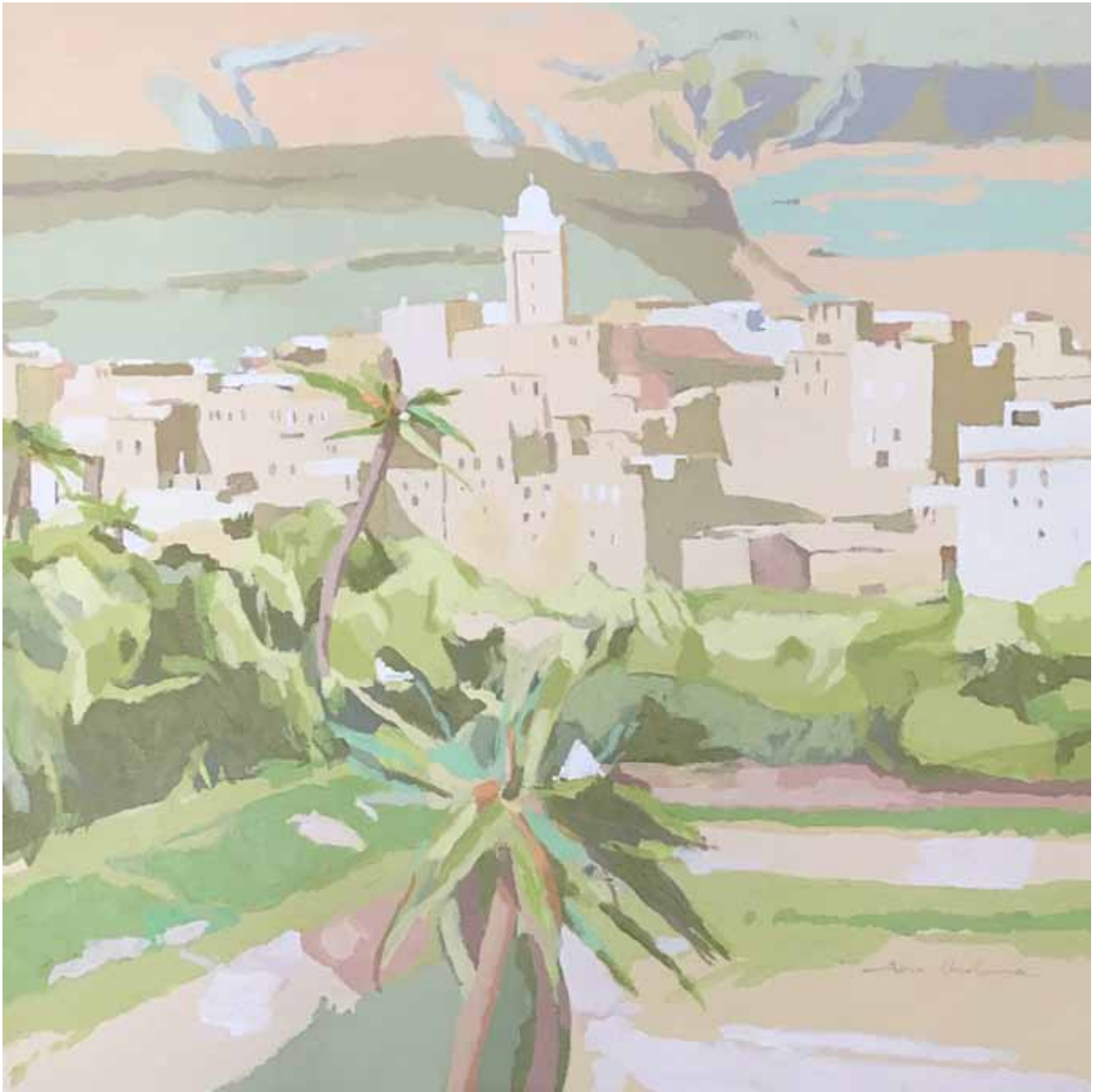
KASBAH DE MEDIODÍA Acrílico sobre lienzo 50x50 cm