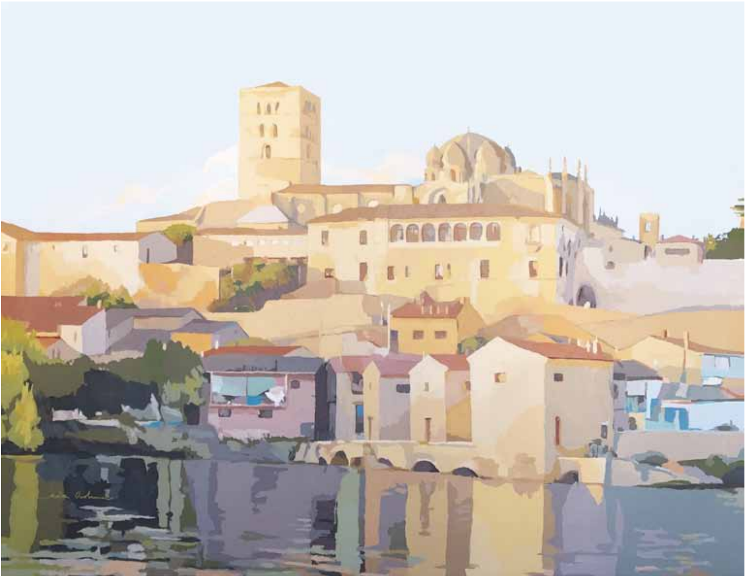
ASOMADA AL DUERO III Acrílico sobre lienzo 89x116 cm