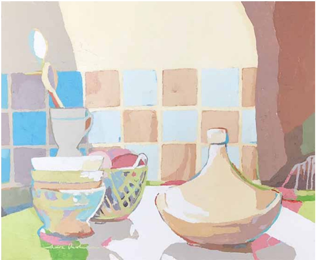
ALACENA CON TAJINE Acrílico sobre lienzo 38x46 cm