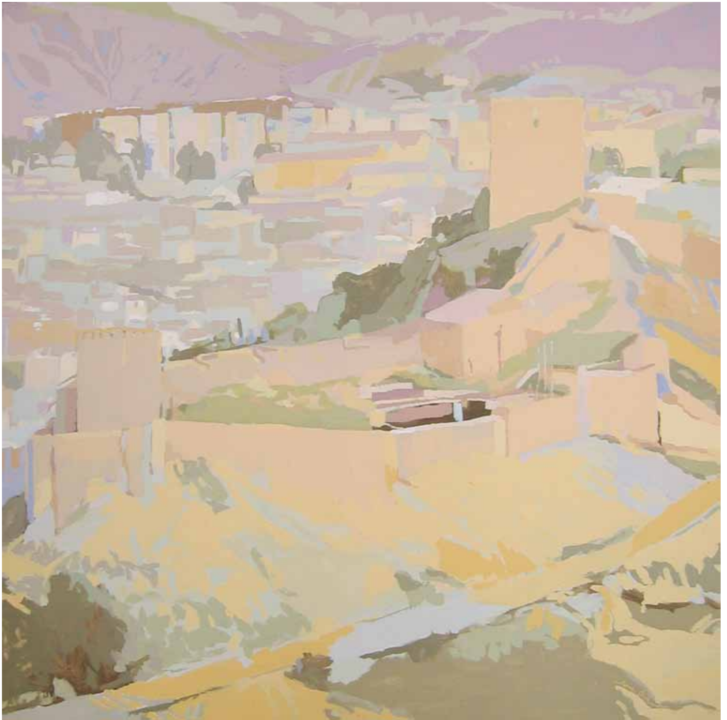
FORTALEZA DEL SOL II Acrílico sobre lienzo 100x100 cm