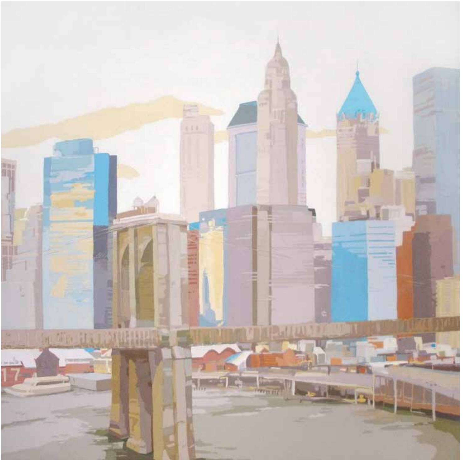
PIER 17 NYC II Acrílico sobre lienzo 195x195 cm