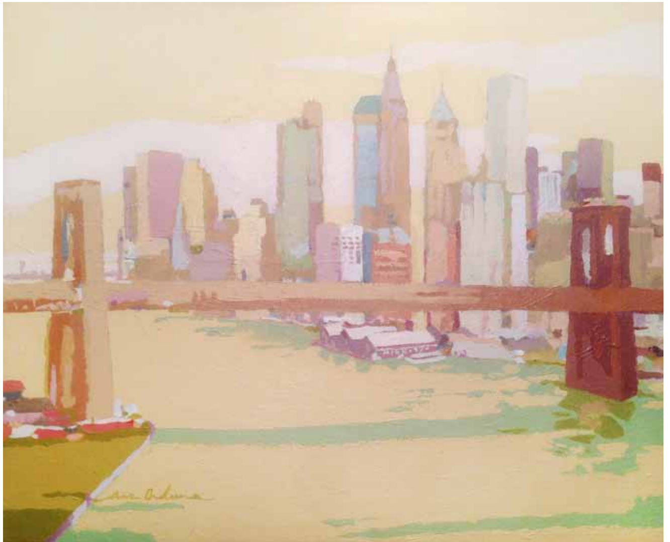
NEW YORK, NEW YORK III Acrílico sobre lienzo 38x46 cm