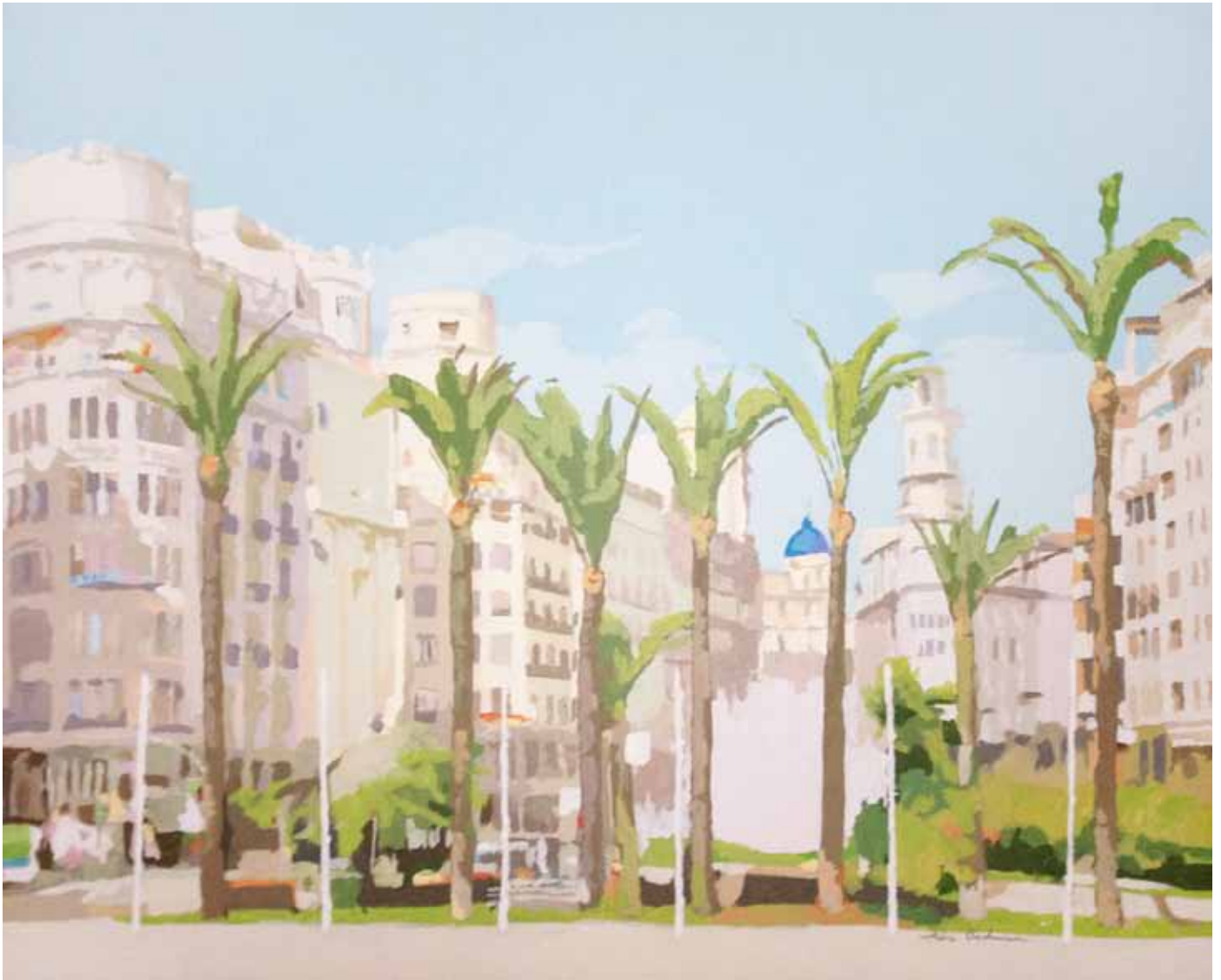
OCHO PALMERAS Acrílico sobre lienzo 81x100 cm