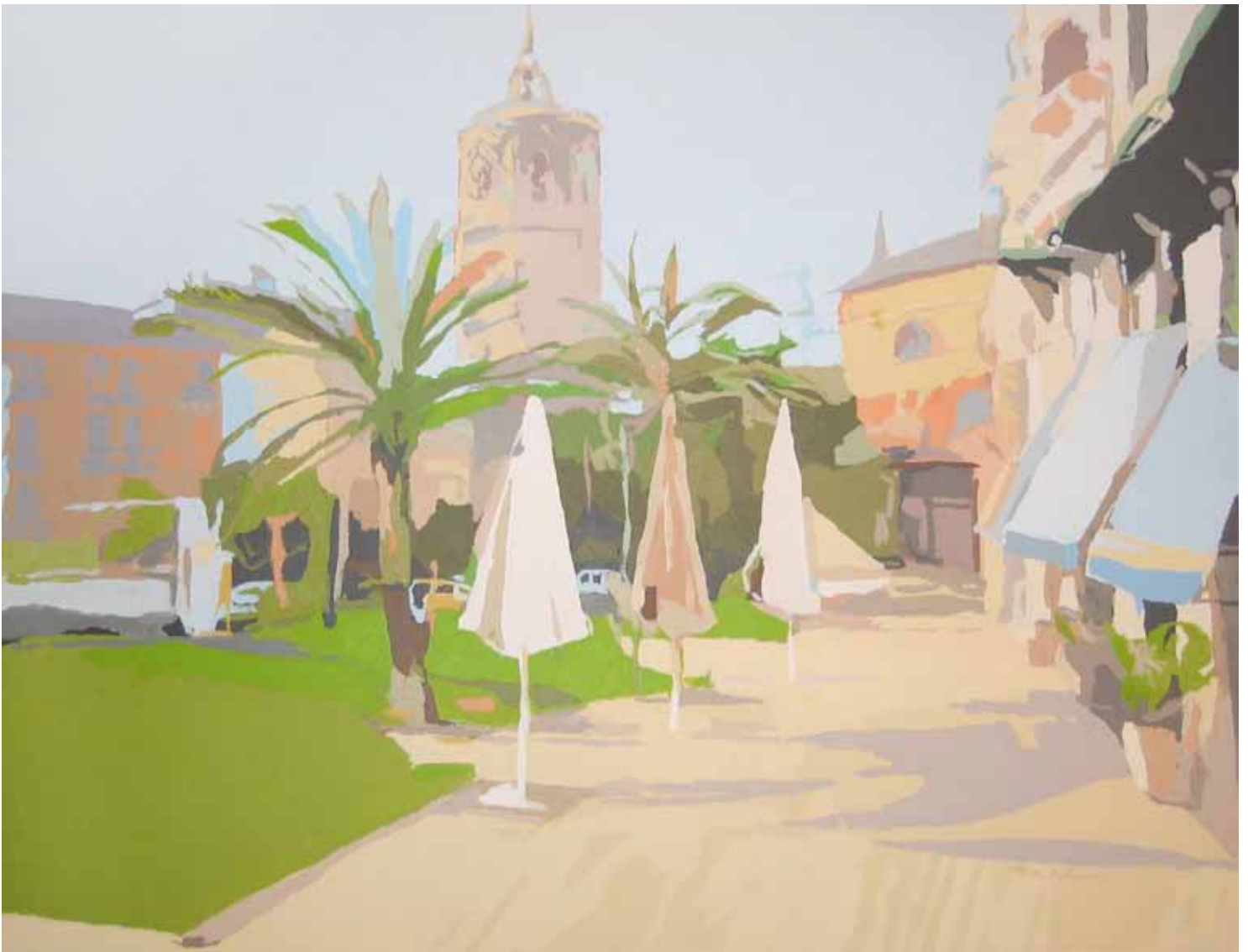
TOLDOS (Micalet) Acrílico sobre lienzo 89x116 cm